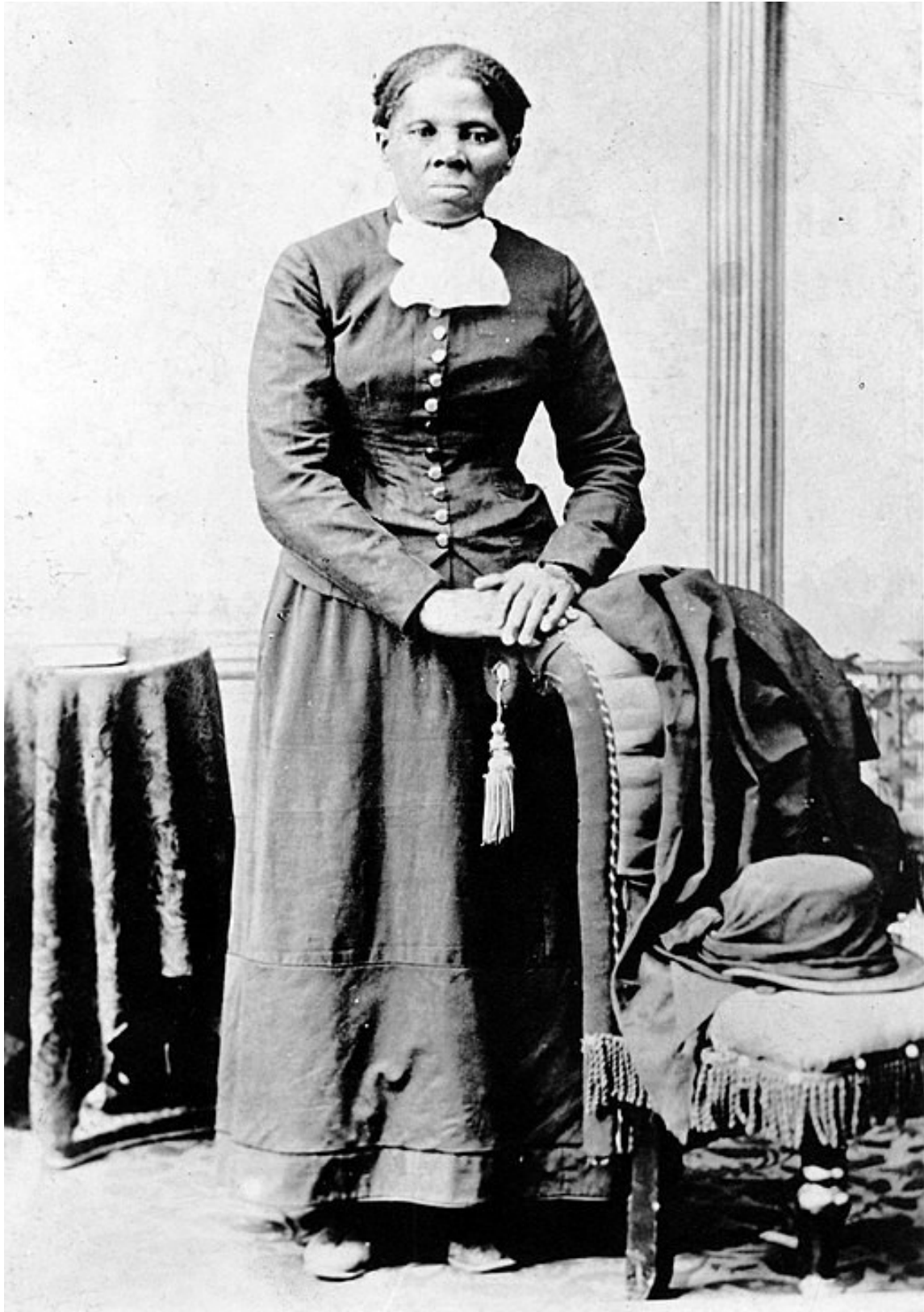
Bild 1: Harriet Tubman, aufgenommen zwischen 1871 und 1875, [abgerufen: 21.02.2025]