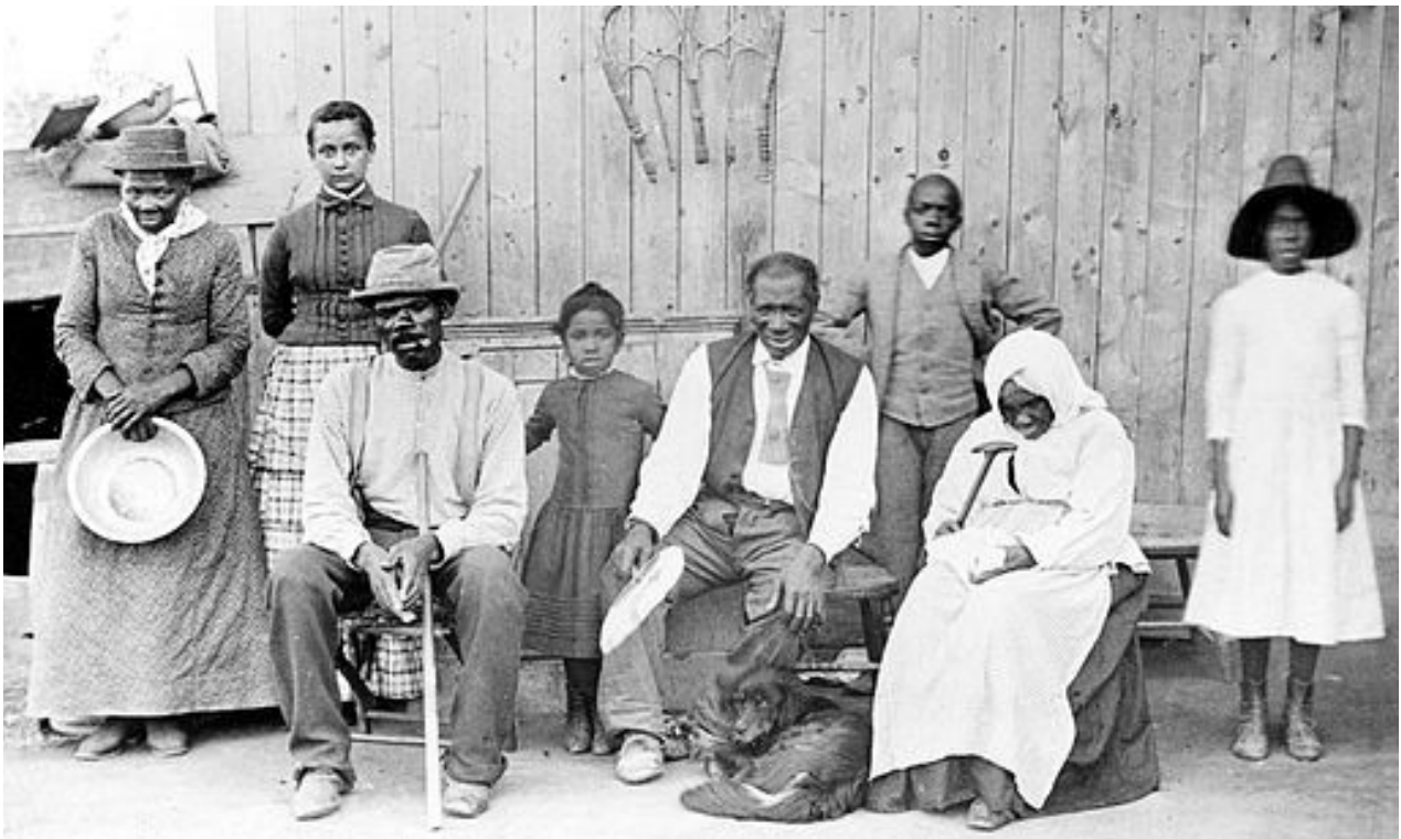
Bild: Harriet Tubman (links) mit Familie / geretteten Sklaven, aufgenommen um 1885, [abgerufen: 21.02.2025]