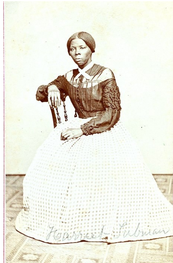
Bild 2 (links): Steckbrief